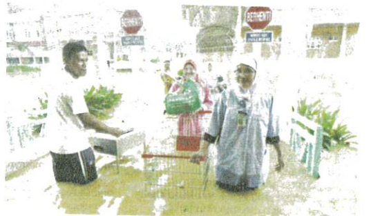
Petugas berusaha memindahkan pesakit sewaktu kejadian bah kuning pada tahun 2014.