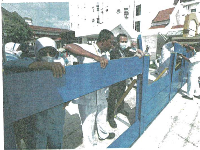
Ready for disaster: Hospital Raja Perempuan Zainab II staff members practising the setting up of barricades to avoid major floods in Kota Baru, Kelantan. Under the 11th Malaysia Plan's First Rolling Plan, the government has approved a flood mitigation project for the hospital at a cost of RM8mil, with the aim of improving disaster-relief infrastructure in the state.

The warning was based on forecasts by MetMalaysia, the South-East Asia-Oceania Flash Flood Guidance System and the IDD flood forecast model.