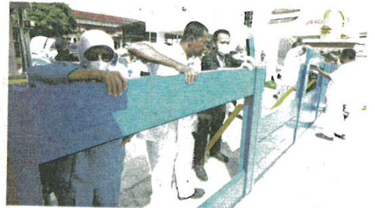
Petugas HRPZ II melakukan latihan amali memasang penghadang banjir bagi mencegah kejadian banjir besar luar jangka seperti bah kuning.

"Projek ini mengambil masa 30 bulan untuk disiapkan dan sejumlah 15 pagar penghadang banjir dibina, bertujuan menghalang kemasukan air ke kawasan hospital," katanya. - Bernama