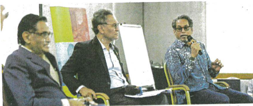
Khairy bersama Dr Dzulkefly (tengah) dan Dr Subramaniam (kiri) pada Forum Kesihatan Universal Malaysia 2022

Bercakap sebagai panel pada Forum Kesihatan Universal Malaysia 2022, semalam, Khairy berkata, sekarang adalah masa yang tepat untuk menjayakan agenda kesihatan negara dan landskap